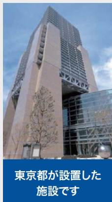
東京都が設置した施設です