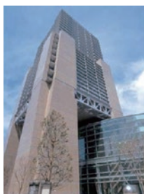
東京都が設置した 施設です