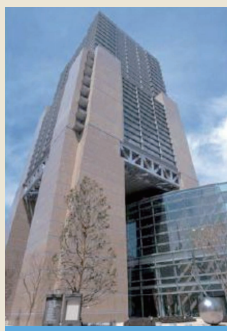
東京都が設置した 施設です